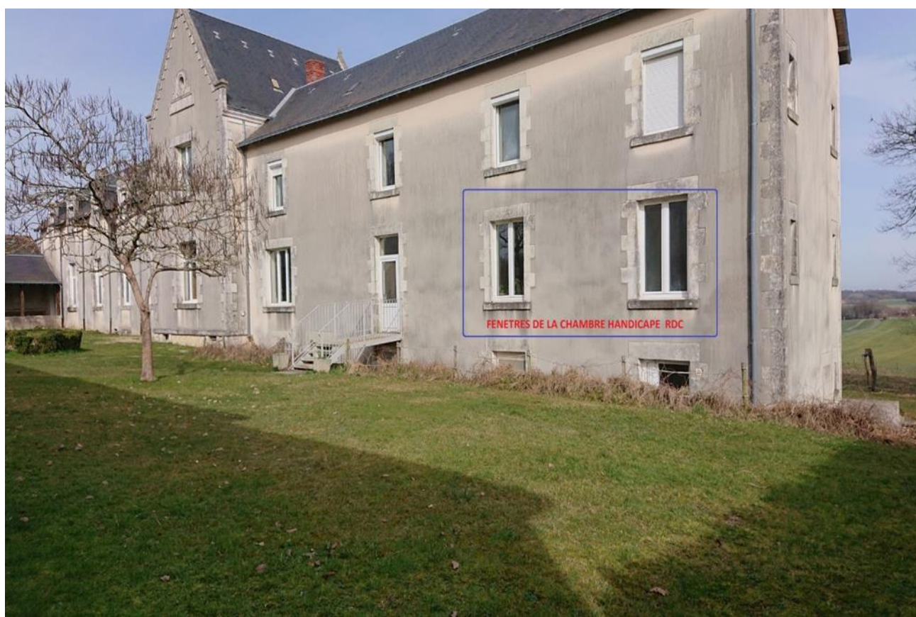
Photo de la façade : deux fenêtres de la chambre et salle de bain PMR