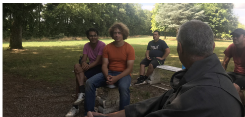
Petit pélé à Notre Dame de Pellevoisin.